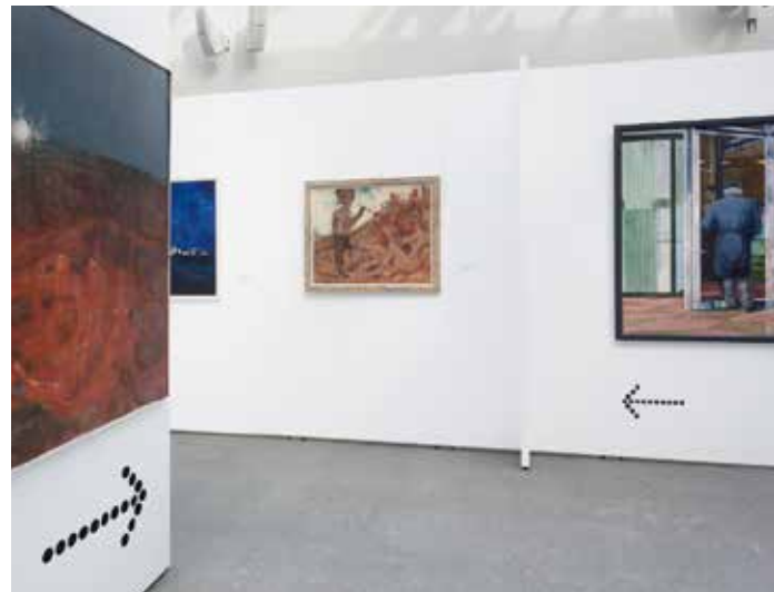
Durch kreativen Umgang mit Wänden können die Hygienemaßnahmen eingehalten werden ohne den Kulturgenuss der Besucher zu stören.

Die vom Bund bereitgestellten Fördermittel können Sie zur Anschaffung von Mila-wall-Stellwänden nutzen. Während der Corona-Regelungen leisten die Wandelemente wertvolle Dienste in der Besucherführung. Danach sind sie viele Jahre als ästhetische Wandsysteme nutzbar. Auf diese Weise bietet die Pandemie sogar eine Chance auf eine nachhaltige Investition in Krisenzeiten.