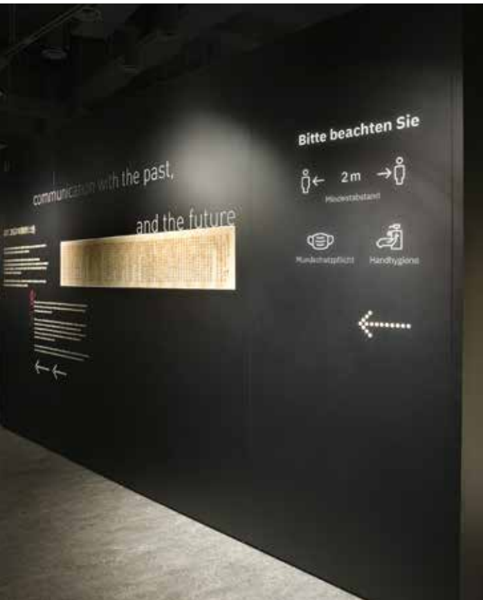
Die Wände können mit Richtungshinweisen beschriftet werden

Mit dem Förderprogramm Neustart Kultur unterstützt die Bundesregierung Kultureinrichtungen bei der Umsetzung von investiven Schutzmaßnahmen anlässlich der Ausbreitung der COVID-19-Pandemie sowie mit Blick auf zukunftsgerichteten Investitionen zur Stärkung der Attraktivität der Kultureinrichtungen bei Wiedereröffnung und Weiterbetrieb.